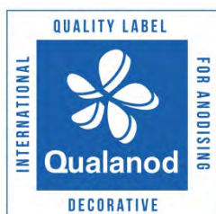
g) Ejemplo del uso de la etiqueta de la marca con texto adicional, según se requiera