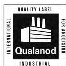
h) Ejemplo donde el recuadro interior de la etiqueta se estampa o se imprime directamente sobre cinta o en pegatinas adhesivas

PEARY LTD OPEX STREET ANNATOWN RESPUBLICIA