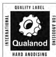
e) Ejemplo de la etiqueta de la marca en blanco y negro