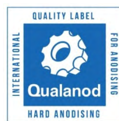
d) Etiqueta para el anodizado duro